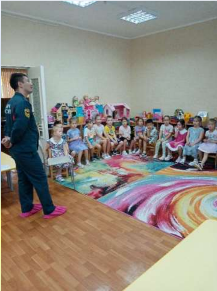
Встреча с инспектором пожарной части