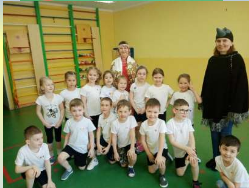
Отмечаем праздник Вороний день