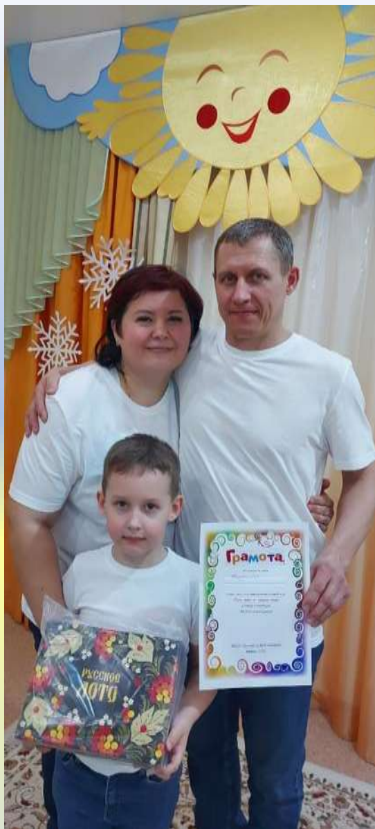
Победители игры «Папа, мама, я – дружная семья»