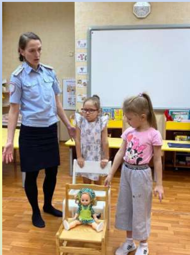
Встреча с инспектором ГИБДД