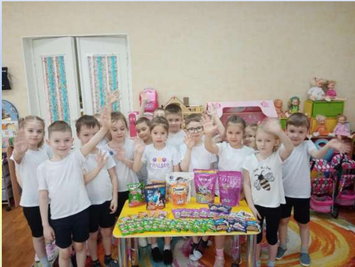
Подарки для хвостиков