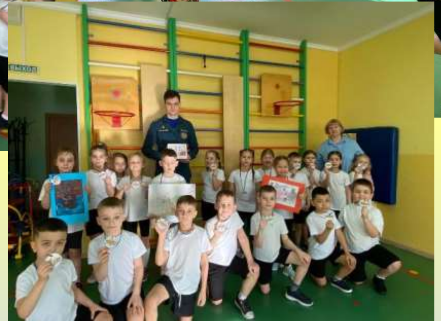
Развлечение «Дружина юных пожарных»