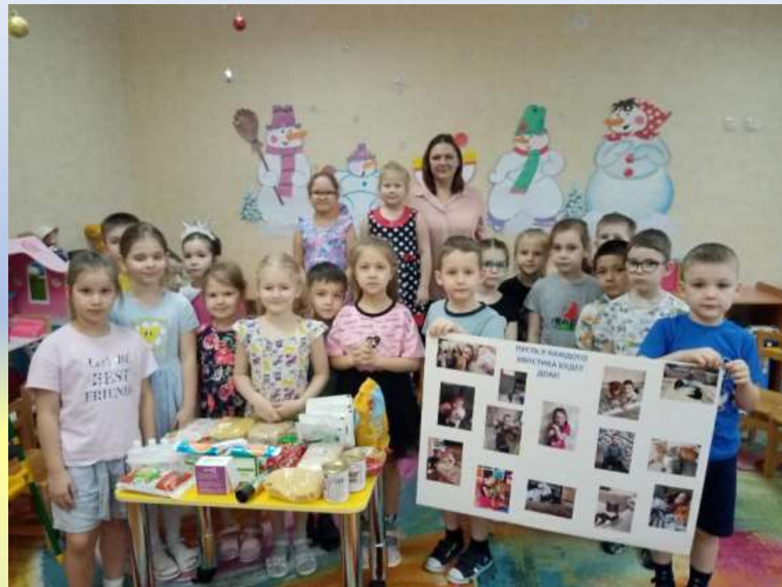
Встреча с волонтером группы «Право на жизнь»