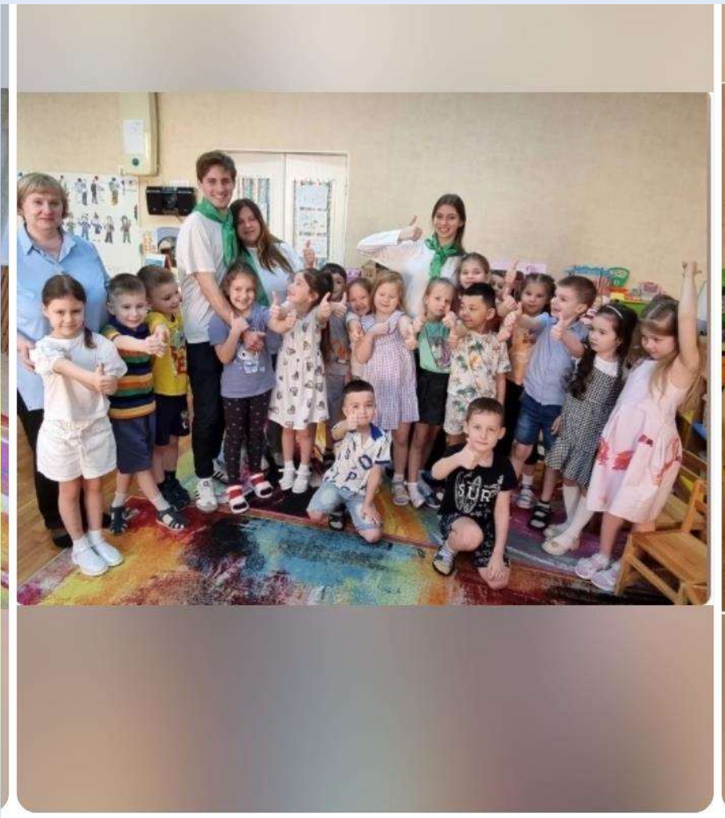
Встреча с обучающимися педагогического класса