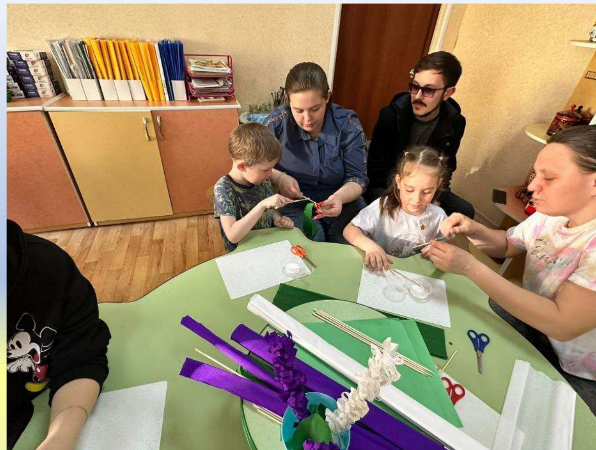
Мастер класс «Символы Победы»