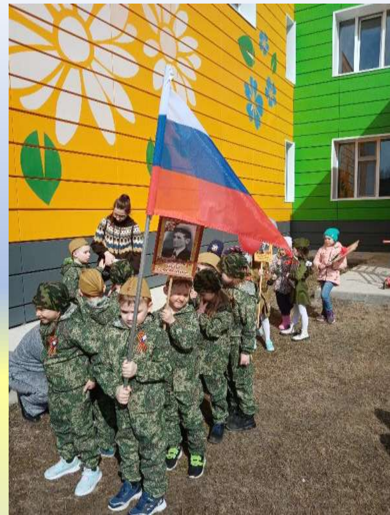
Наш парад Победы в детском саду