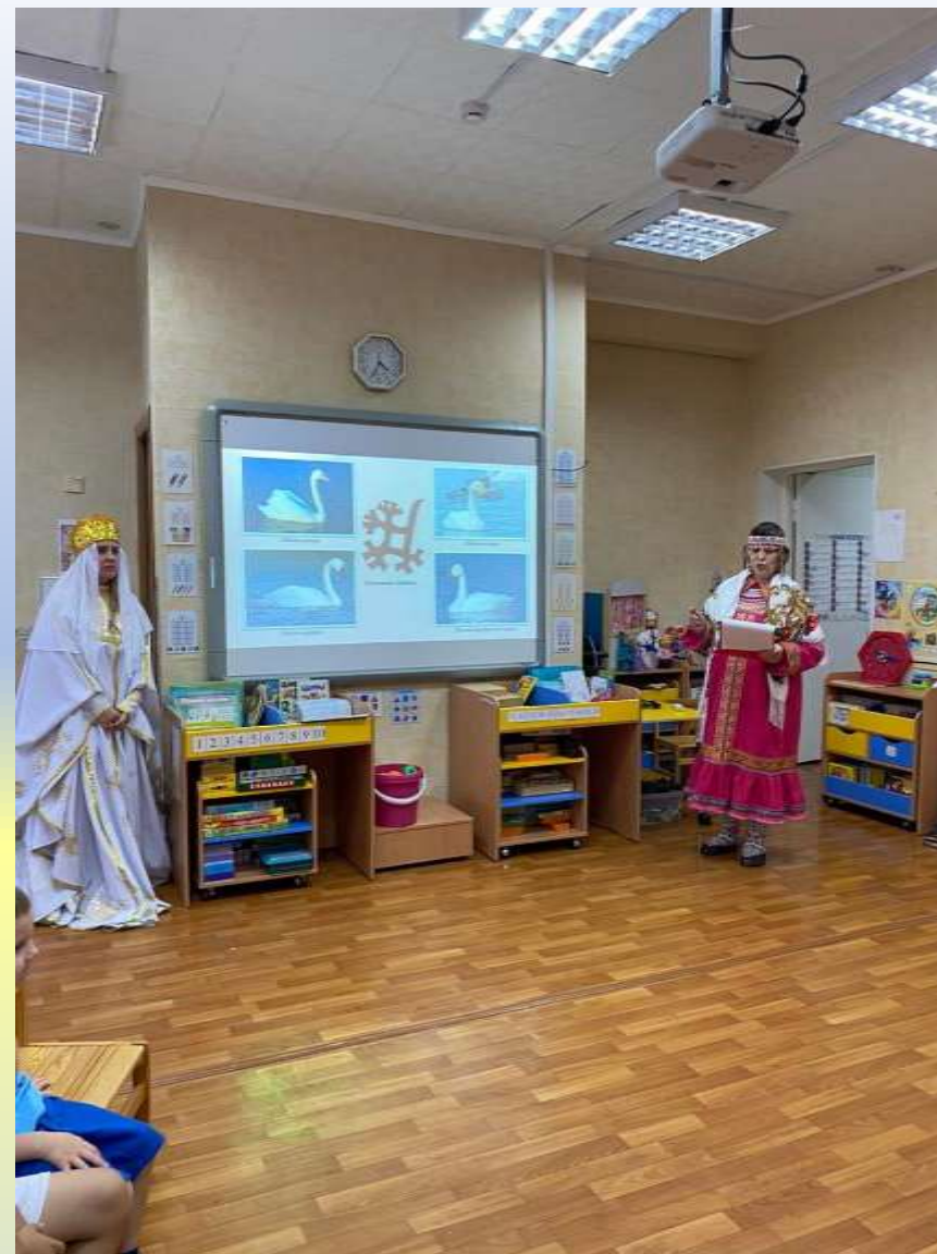
Хантыйский праздник «Проводы лебедя»